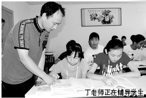
丁老师正在辅导学生

采访中记者了解到,丁老师文化培训学校以高质量的师资配备不但得到了众家长的热捧,也吸引来很多重点中学老师的子女前来学习。某重点中学高级英语教师王老师说,丁老师文化培训学校的老师是名副其实的中学的名优老师,有些还是中招命题组的专家。“名师出高徒”,也就不难理解连老师子女也热捧的原因了。