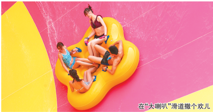
在“大喇叭”滑道撒个欢儿

近日,和黄河谷·马拉湾的负责人喝茶聊天,在谈到现代都市人的幸福感和快乐值时,我领悟到了马拉湾火爆经营的秘笈所在,那就是爽快随心、快乐就好。