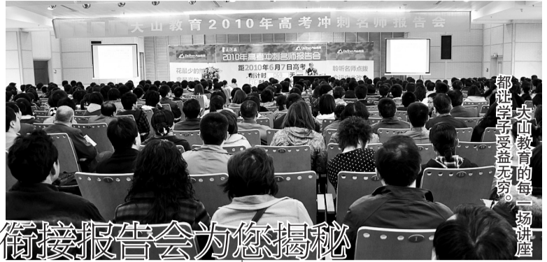
大山教育的每一场讲座 都让学子受益无穷