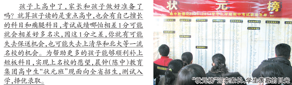
“状元班”迎来家长,学生羡慕的目光

孩子上高中了,家长和孩子做好了准备吗?就算孩子读的是重点高中,也会有自己擅长的科目和瘸腿科目,考试成绩哪怕相差1分可能就会相差好多名次,因这1分之差,你就有可能失去保送机会,也可能失去上清华和北大等一流名校的机会。为帮助更多的孩子能够顺利考上短板科目,实现上名校的愿望,晨钟(陈中)教育集团高中生“状元班”现面向全省招生,测试入学,择优录取。