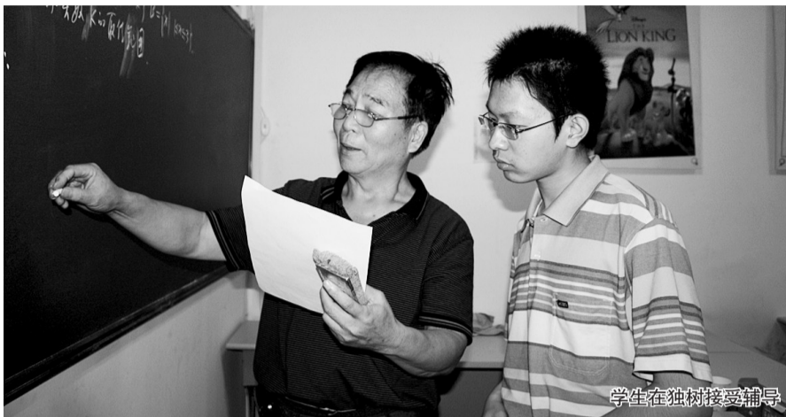
学生在独树接受辅导