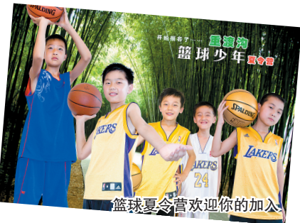
篮球夏令营欢迎您的加入

给孩子一个快乐并有意义的假期,遵循他们的天性,发掘他们的特长爱好,让孩子绽放天才本色,拥有强壮身体,赢在未来!这个暑假,让孩子远离电脑、电视,快乐学习,快乐成长!如果你的孩子热爱篮球,那就让他们参加重渡沟篮球少年夏令营吧!重渡沟篮球少年夏令营即将快乐起程,让孩子们在快乐中学习,在汗水中铸造强壮的身体、坚韧的性格,在团队中收获友谊、学会感恩,培养独立自主的能力。