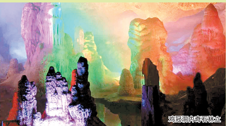
鸡冠洞内奇石林立

在烈日炙人的夏日里,鸡冠洞只有18℃。宛如一个与世隔绝的清爽世界,使游人尽享清凉之惬意。