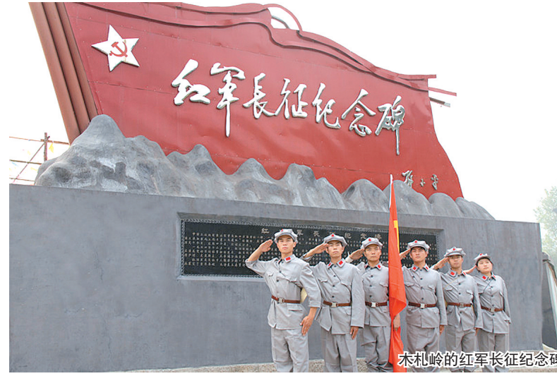
木札岭的红军长征纪念碑