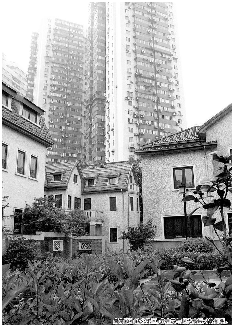
南京颐和路公馆区，老建筑与现代高层对比鲜明。

目前，该产业园已引进100多家企业，所有前来洽谈的客商，都被老房子厚重的历史文化所吸引。