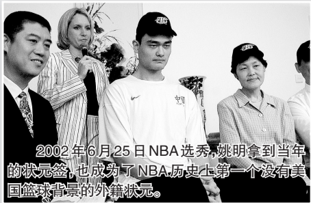
2002年6月25日NBA选秀，姚明拿到当年的状元签，也成为了NBA历史上第一个没有美国篮球背景的外籍状元。