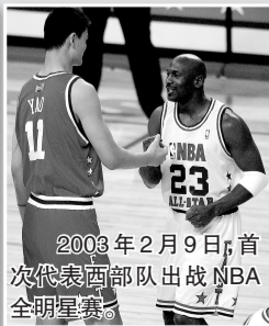
2003年2月9日，首次代表西部队出战NBA全明星赛。