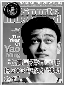
美国《体育画报》把2003年称为“姚明之年”。