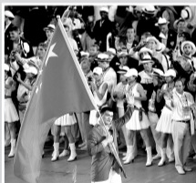
2008年8月8日，姚明作为中国代表团旗手走进了鸟巢。