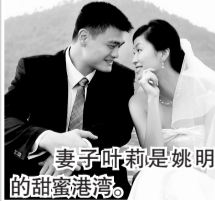
妻子叶莉是姚明的甜蜜港湾。