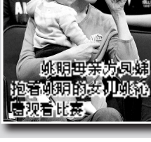
姚明母亲为儿媳抱着姚明的女儿姚沁婷看电视比赛。