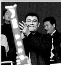
2009年7月，姚明成为上海男篮的老板。