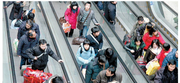
郑州一家商场里扶梯站满人。资料图片