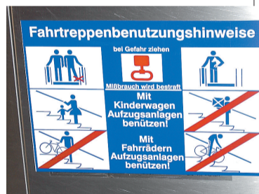
国外扶梯上贴的安全标示