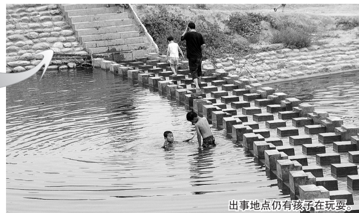
出事地点仍有孩子在玩耍。