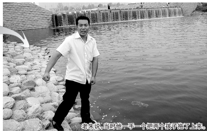
老朱说,当时他一手一个把两个孩子拖了上来。