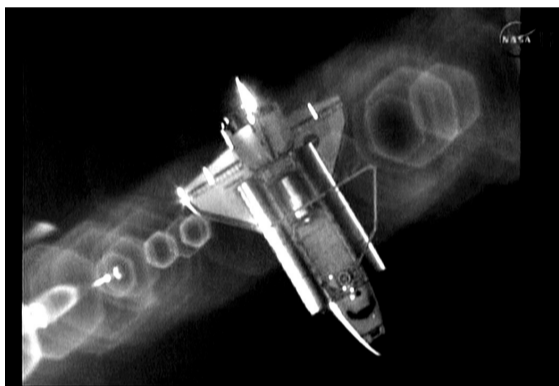
这张7月19日拍摄的视频截图显示,“亚特兰蒂斯”号航天飞机离开国际空间站,启程返回地球。