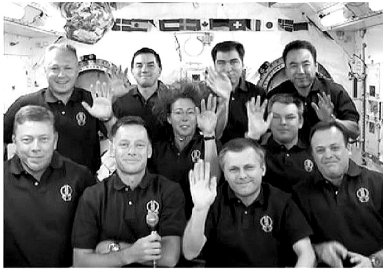
7月15日,国际空间站和航天飞机“亚特兰蒂斯”号的宇航员在与美国总统奥巴马通话结束后挥手致意。

“当然难以接受。”宇航员史蒂夫·鲁滨逊说,“因为,为了飞向太空,我们奉献一生……作为宇航员,我们视之为生命。”