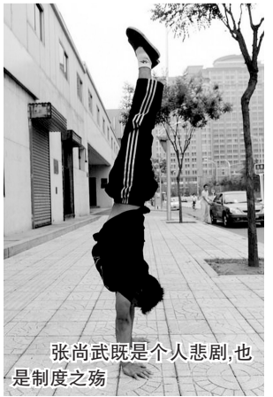
张尚武既是个人悲剧,也是制度之殇