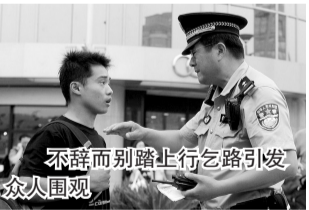
不辞而别踏上乞路引发众人围观