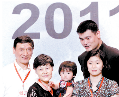
7月20日,姚明(右上)和父亲姚志源(左一)、母亲方凤娣(左二)、女儿姚沁蕾(中)、妻子叶莉在新闻发布会上。