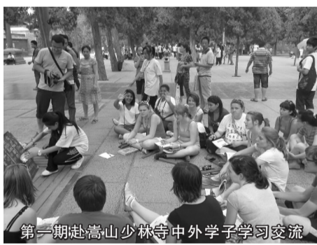
第一期赴嵩山少林寺中外学子学习交流

郑州市基石中学“游学夏令营”2011年第一期已顺利开营,活动贯穿联合国教科文组织提出的“四个学会”,即“学会生存、学会合作、学会沟通、学会学习”。基石中学牵手世界名校,开展各类中西文化交流活动,已成为基石中学历年暑假的一大亮点。