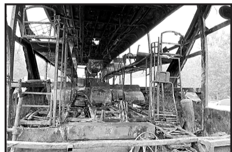
大客车烧得只剩下骨架

事故车隶属于威海交通运输集团二公司。该公司办公室毕主任称,该车已被个人承包,“车主好像是乳山人”。事故发生后,二公司曾联系承包方,但没有联系上,拨打开车司机的电话,也没有拨通。