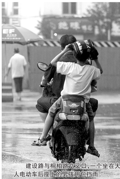
建设路与桐柏路交叉口,一个坐在大人电动车后座上的男孩用包挡雨。