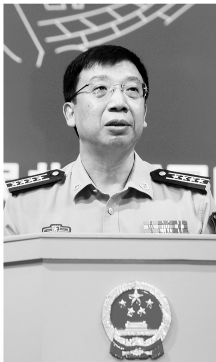
国防部新闻发言人耿雁生大校

耿雁生强调,中国坚决奉行防御性的国防政策,近海防御的海军战略也没有发生转变。耿雁生指出,披露航母相关信息的时机与当前南海局势无关。