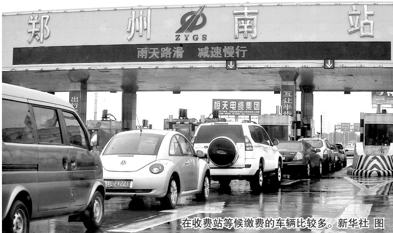
在收费站等候缴费的车辆比较多。