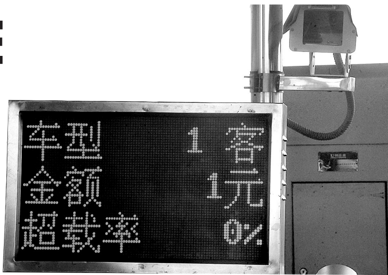
郑州环城高速通行费最低1元。新华社图