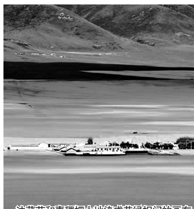
油菜花和青稞把大地染成黄绿相间的画布