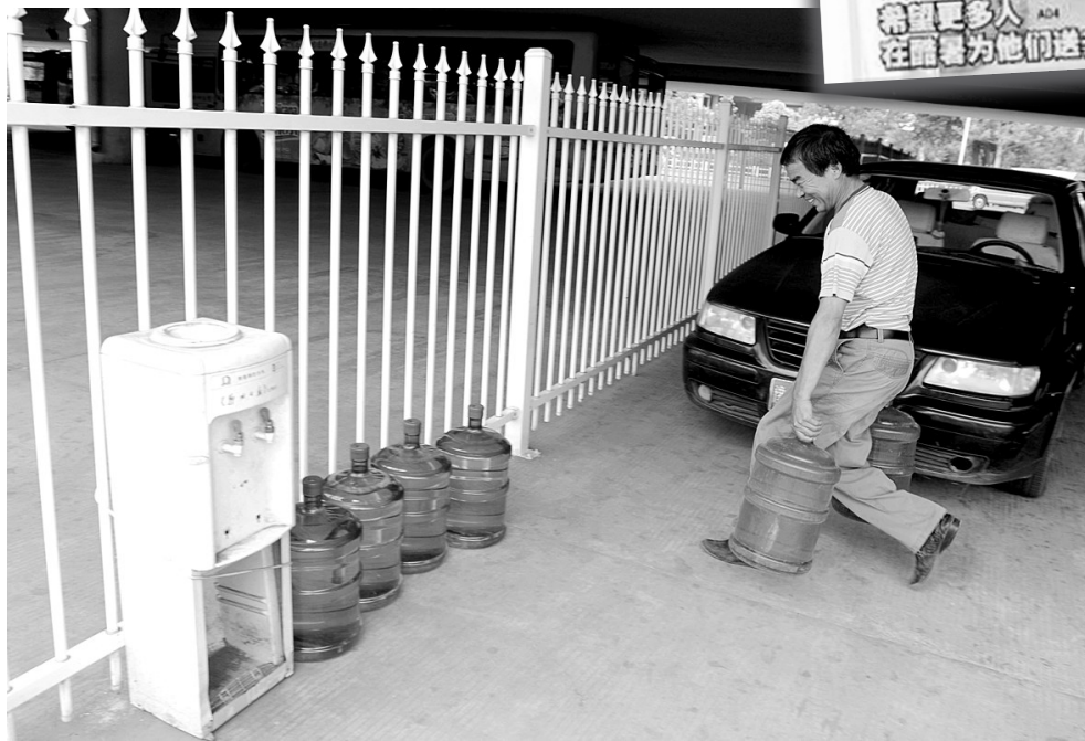
上个月,我第一次拍到的“送水哥”送水时的照片。