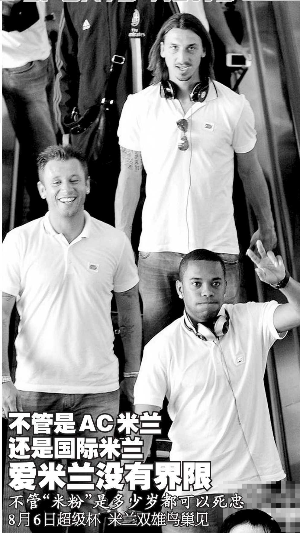
米兰抵达,球员神清气爽