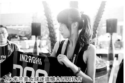
AC米兰美女球迷遗憾未见因扎吉