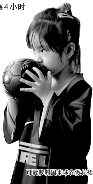
可爱萝莉国米球衣做长裙

10时50分,国际米兰的球员出现在国际出口,走下了电梯,球迷们则如两年前一样表达着他们的热情。最终,国际米兰球员们马不停蹄地登上了大巴,开赴中国大饭店。