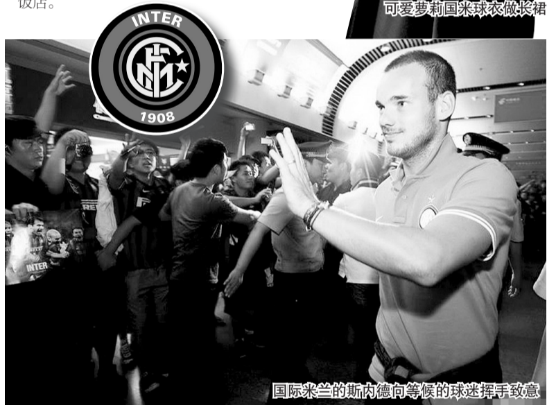
国际米兰的斯内德向等候的球迷挥手致意