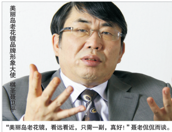
美丽岛老花镜品牌形象大使 棋圣聂卫平