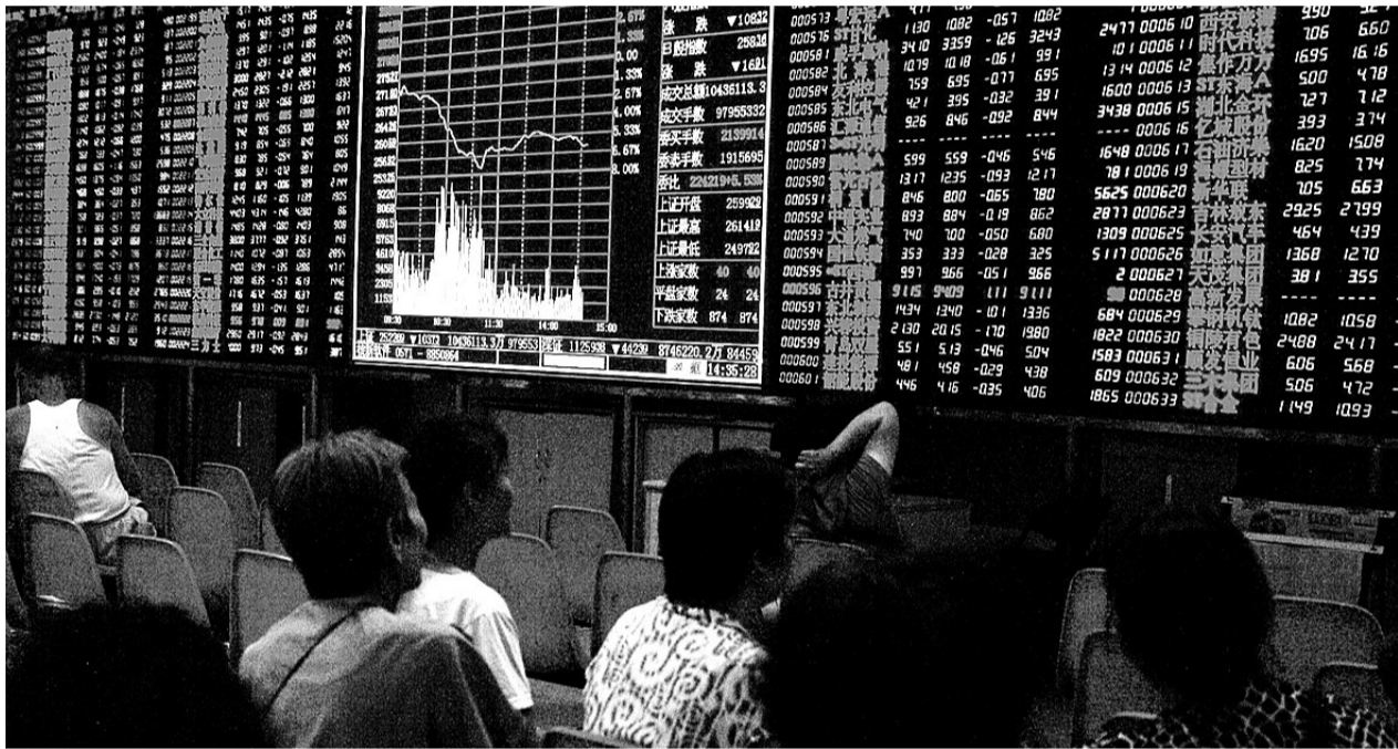
市内一家证券交易所内,股民没几个,股指曲线走得实在难看。

昨日,新浪网组织了“大盘底部在哪里?”的调查。截至昨日下午5时30分许,共有61200多人参与。结果,40.9%的人认为,沪指将跌至2000点以下。“美信用评级能否导致新一轮金融危机?”截至昨日下午5时30分许,共有49200多人参与。结果,66.3%的人认为“会”,19.7%的人认为“不会”,14.1%的人认为“不好说”。“你是否看好美国经济前景?”71.7%的人表示“不看好”,10%的人表示“看好”,11.3%的人表示“不好说”。