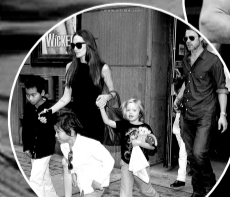
皮特与朱莉如今已成模范父母