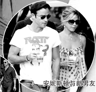
安妮斯顿与新男友