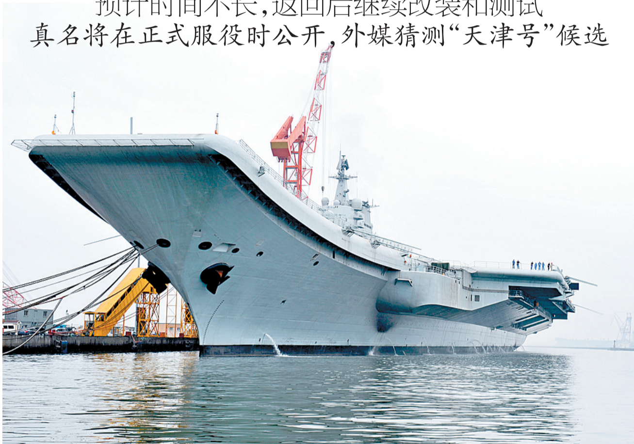
中国航母平台8月10日进行出海航行试验,图为拍摄于大连的中国航母平台。(资料照片)

未使用本身动力,拖船拖离码头 预计时间不长,返回后继续改装和测试 真名将在正式服役时公开,外媒猜测“天津号”候选