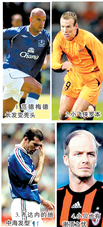
1.范德梅德 长发变秃头