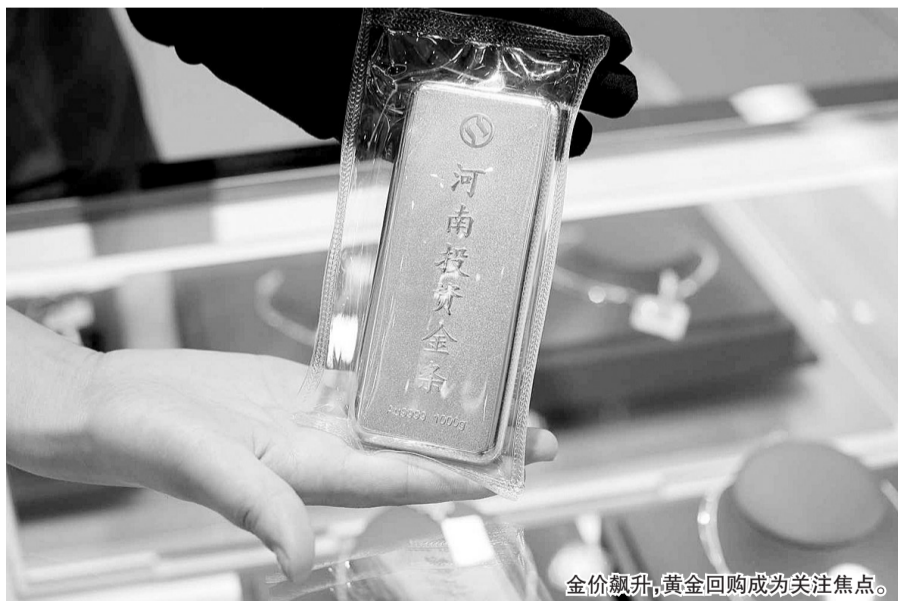
金价飙升,黄金回购成为关注焦点。