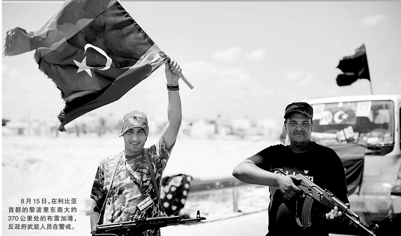
8月15日,在利比亚首都的黎波里东南大约370公里处的布雷加港,反政府武装人员在警戒。