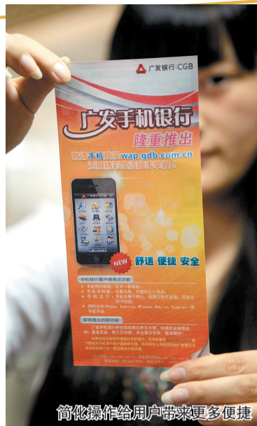
简化操作给用户带来更多便捷

简化网上银行操作流程,无需注册就可直接登录 不但可以在线理财,还可足不出户充值缴费