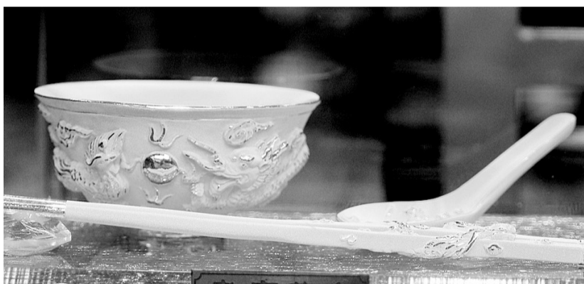
制作精美的金碗

但就在此背景下,在上海期货交易所黄金期货(下称“沪金”)的持仓排名中,却惊现多家银行的做空身影——截至23日收盘,兴业银行、民生银行、农业银行、浦发银行全部入围沪金1112合约空方持仓量前10名,持仓量合计高达7244手(每手为1千克)。而在前20名多方名单中,却无一银行在列。