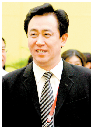
恒大地产集团董事局主席、广东河南商会会长 许家印

说到这次再回家乡,许家印说,一方面将要进一步加快投资步伐,全力支持河南的建设,通过全方位、多领域的战略合作,为老百姓带去高性价比的民生精品住宅,继续推动当地的经济、教育等事业的发展。另一方面,作为广东省河南商会会长,还将进一步加强与两地各级政府的紧密联系,带动和鼓励更多的企业家加入到投资家乡、建设河南的行列,推动家乡又好又快发展。