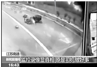
车到之前老人已摔倒。