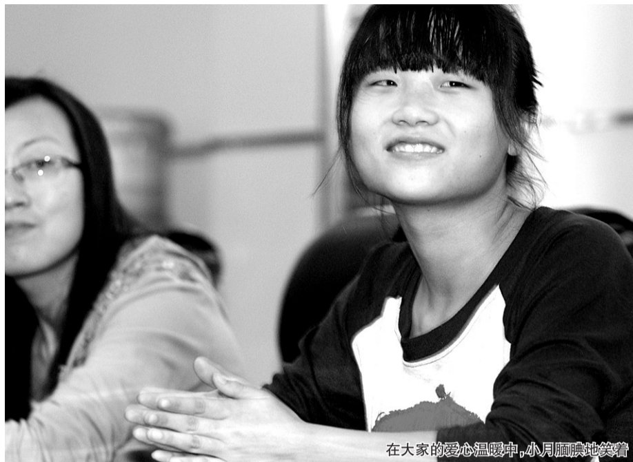
在大家的爱心温暖中,小月腼腆地笑着