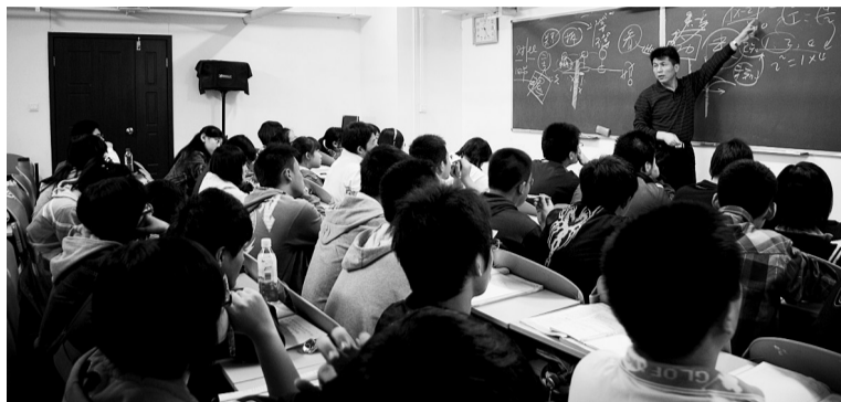
红旗的大班课很受欢迎