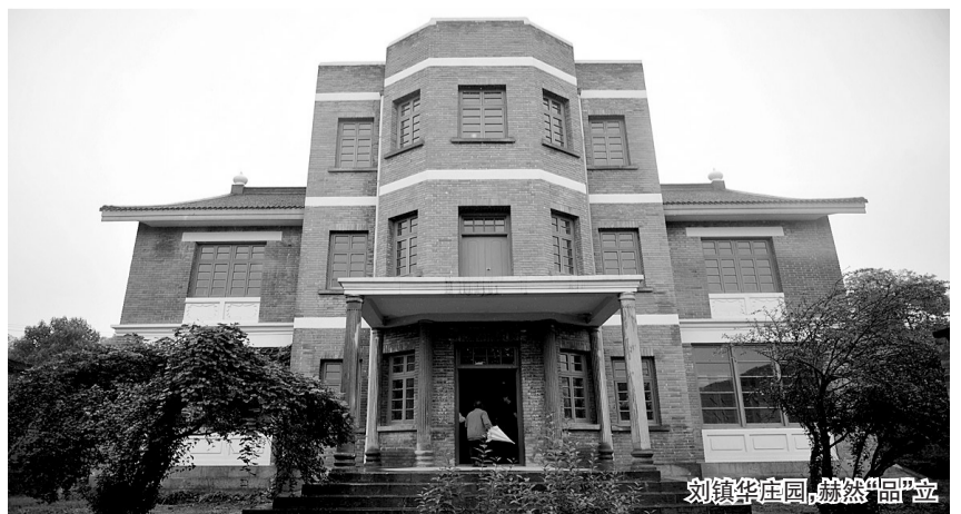
刘镇华庄园,巍然“品”立