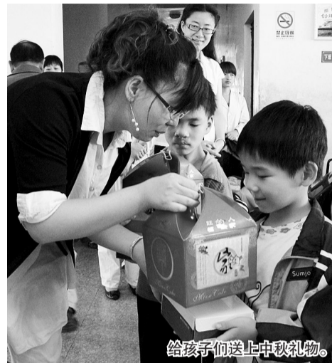
给孩子们送上中秋礼物。