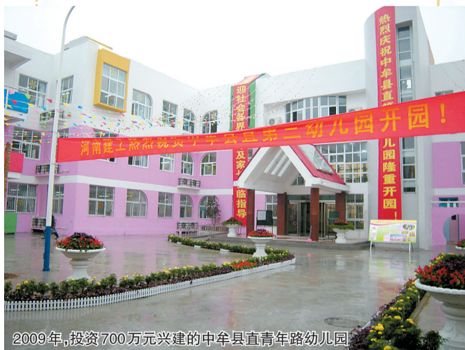
2009年,投资700万元兴建的中牟县直青年路幼儿园。

“回首中牟教育近年来的发展历程,可以说一年一个主题,一步一个台阶,教育改革不断向纵深推进,教育质量和效益全面攀升,中牟率先进入河南省义务教育均衡发展先进县行列,教育开启了中牟经济和社会发展的新天地,大大推进了中牟社会跨越发展的进程……”