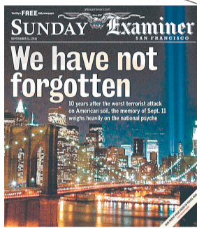
美国《旧金山问询报》