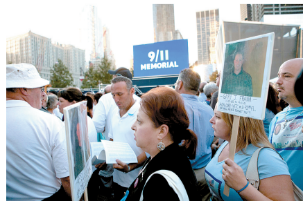
在“零地带”附近出席活动的民众。