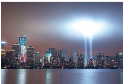
象征世贸中心双塔大厦的灯柱亮起。