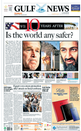
阿联酋《海湾新闻报》