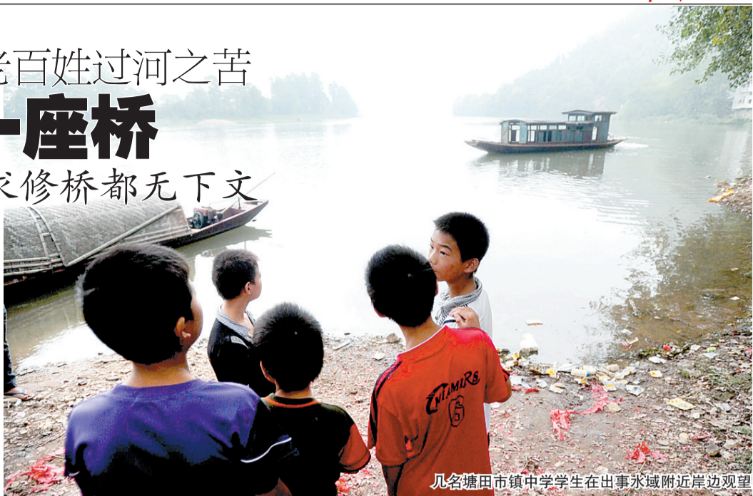
几名塘田市镇中学学生在出事水域附近岸边观望