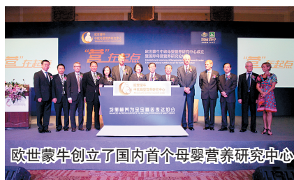
欧世蒙牛创立了国内首个母婴营养研究中心

授分别就各自的研究领域对“早期全面均衡营养补充对基因表达的影响”进行了阐述,为“营养会为基因表达加分”提供了理论支持。