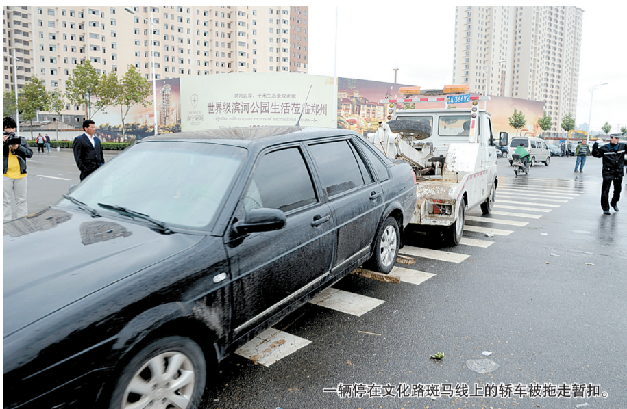
一辆停在文化路斑马线上的轿车被拖走暂扣。