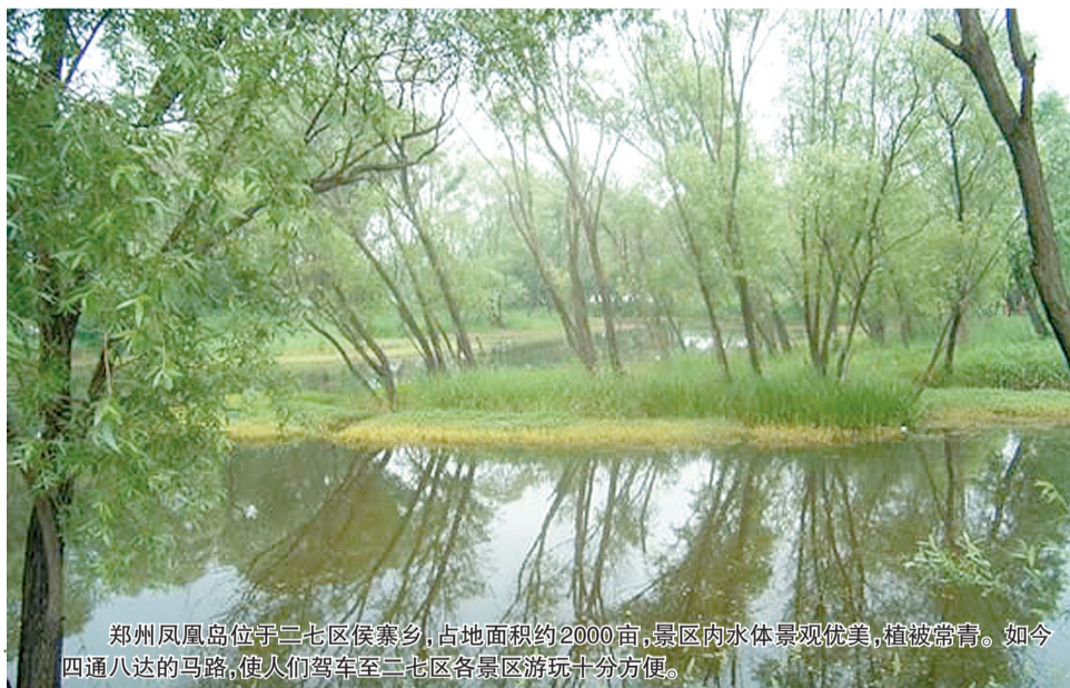
郑州凤凰岛位于二七区侯寨乡,占地面积约2000亩,景区内水体景观优美,植被常青。如今四通八达的马路,使人们驾车至二七区各景区游玩十分方便。

“只有修了路才有出路。”二七区作为郑州市重要的交通枢纽区,城区道路大都是老街道拓宽改造而成,城市发展让辖区承载的交通压力剧增,断头路不仅降低了城区美誉度,也成为制约投资兴业、经济发展的一大因素。“必须多修路、修好路!”