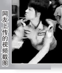
网友上传的视频截图