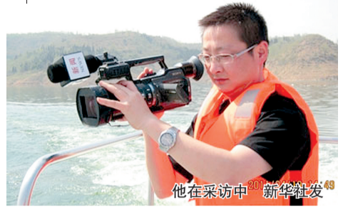
他在采访中