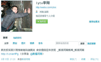
这就是李翔生前发布的最后一条微博