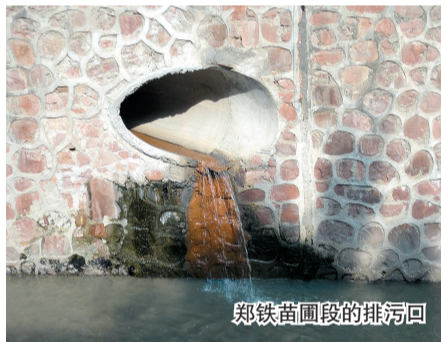
郑铁苗圃段的排污口