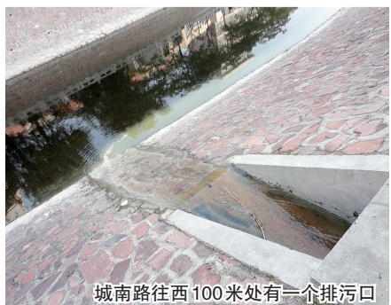
城南路往西100米处有一个排污口