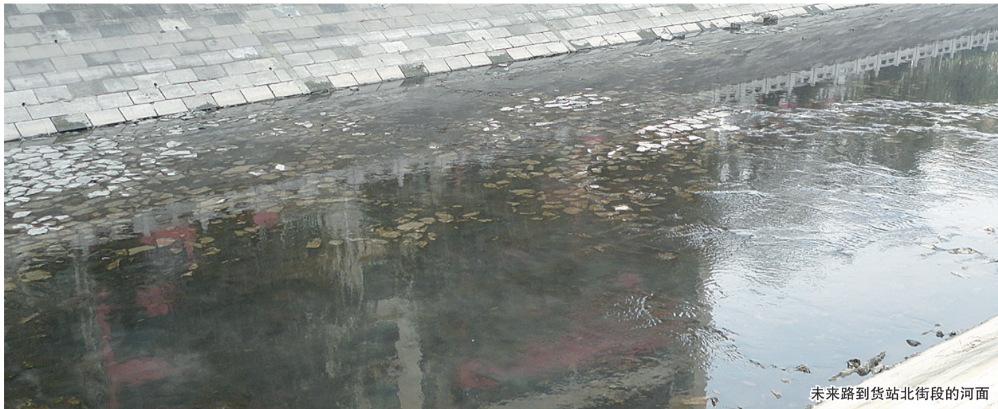
未来路到货站北街段的河面