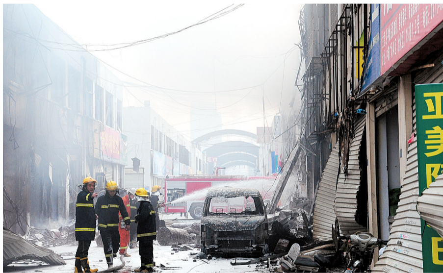
爆炸引起火灾,消防官兵在现场扑救。

昨天7点30分,京广路与南三环交叉口东北角处的中陆化工城内发生爆炸,爆炸点为A14区某店面,爆炸威力巨大,附近二层的窗户玻璃全部震碎,杀伤半径超过30米。