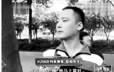
乘客讲述当时发生的情况,并按指印实名举报。