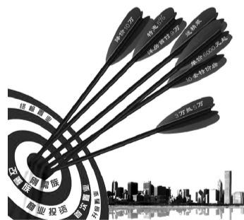
注:本期所有项目优惠以销售中心为准

项目介绍: 是紫荆山路在售的5A甲级写字楼。顶部采用莲花造型,新颖独特,外立面采用进口石材、玻璃幕墙等多种新型材料。所有硬件设备都按照国际标准进行配置,为优秀企业提供了一个良好的商务平台。 位置: 紫荆山路与东西大街交会处北50米 开发商: 郑州日月潭房地产开发有限公司 项目优惠: 2万抵6万、200平方米以上房源2万抵10万。