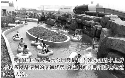
奥帕拉拉冒险岛水公园凭借国内外先进的水上游乐设备以及便利的交通优势，在短时间内吸引游客超过30万人次。

奥帕拉拉冒险岛水公园的运营，必将带来丰富的人气、商气，促进大郑州休闲经济和社会发展。同时，清华·大溪地 CCR 城市文化度假区也将为郑西新城的发展树立新的标杆，成为郑西新城的开篇巨作。